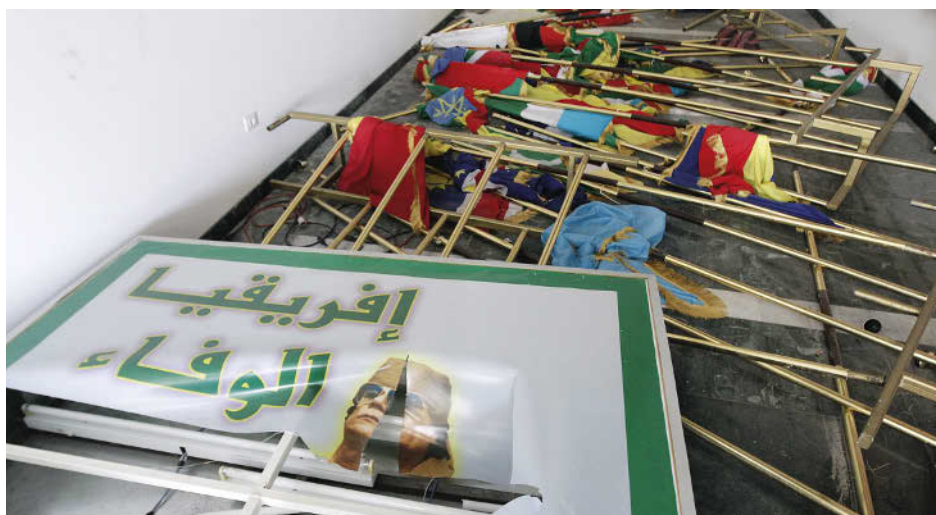
58 Syrte , dont Kadhafi voulait faire la capitale de la Libye, est depuis 2015 sous le contrôle de l'EI, qui a instauré ses règles, avec sa propre police et un tribunal islamique.

3 Édito Ce qui fait notre force par Ziad Limam